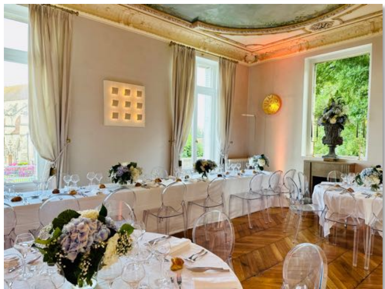
Domaine de Pr cy, 1 Place de l' glise, 60460 Pr cy Sur Oise 06.88.22.13.12 / events@chateauprecy.com